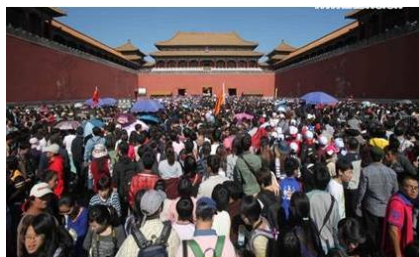
People Mountain, People Sea

Her er nok et forsøk på å gjøre det jeg ikke kan. Enda et fint bilde med China-natur er blitt borte på veien til månedsbrevet, så da gir Redaktøren opp og sender ut et halvhjertet produkt med de varmeste og beste sommerhilsener til dere alle.